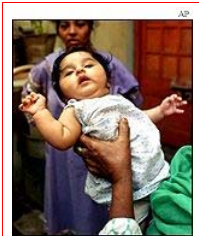
ทารกคนที่ ๑ พันล้านของอินเดีย ตกฟากในปี พ.ศ.๒๕๔๓

องค์การสหประชาชาติมีรายงานเพื่อแจ้งเตือนประเทศสมาชิกให้เตรียมการรองรับภาวะ “Population Explosion” ในระยะเวลาอันใกล้นี้ โดยคาดการณ์ว่าในปี พ.ศ.๒๕๕๓ ประชากรในโลกจะมีจำนวนประมาณ ๕ พันล้านคน มากกว่าในปัจจุบันซึ่งมีจำนวนประมาณ ๖,๗๐๐ ล้านคน